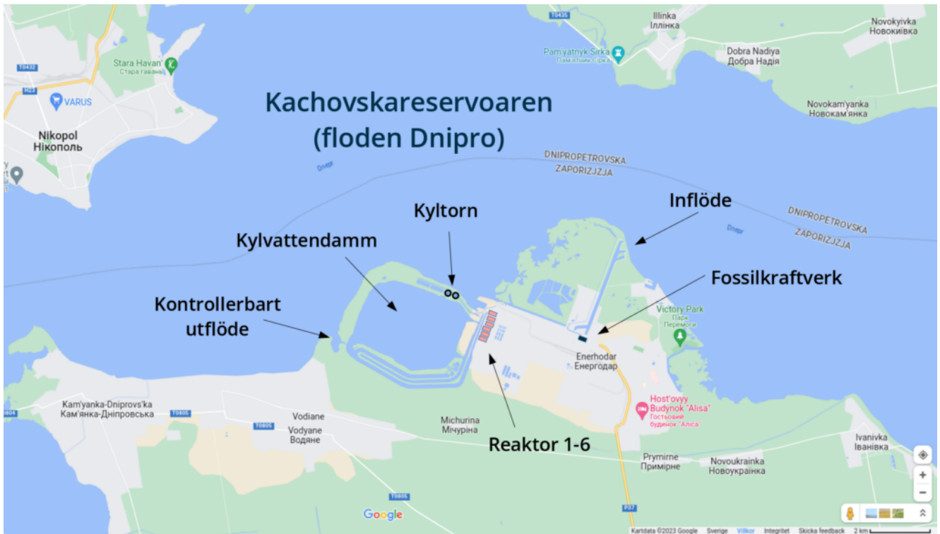
Figur 2: Karta över området vid kärnkraftverket Zaporizjzja. Kartan kommer ursprungligen från Google Maps.

Den dramatiska sprängningen av Kachovskadammen i juni 2023 orsakade en sänkning av vattennivån i floden Dnipro, vilket kan ha konsekvenser för möjligheten att kyla de sex kärnreaktorerna. Kylvattendammen har dock en stor volym vatten och har därför varit tillräcklig för att säkra kylningen. Mer allvarligt har varit de återkommande strömavbrotten som hotat möjligheten att föra in vatten från kylvattendammen till reaktorerna.