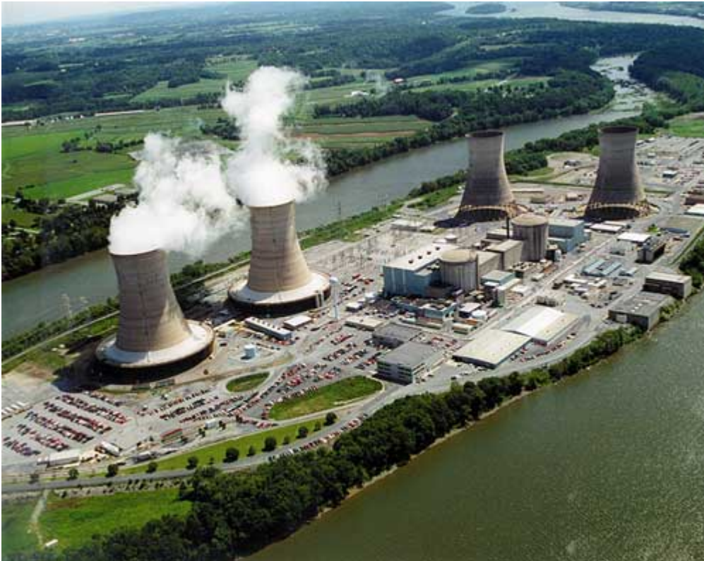
Figur 1. Bilden visar kyltorn vid ett kärnkraftverk i normal drift, där vit vattenånga strömmar ut ur tornen.